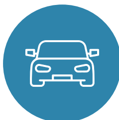
DEPARTAMENTOS DE TRÂNSITO

Integração com a Credora independente do porte da empresa.