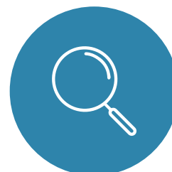
SISTEMA NACIONAL DE GRAVAMES

Conexão contínua com praticamente todos os Detrans.